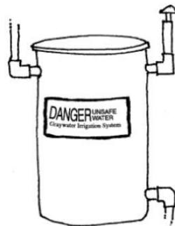
شکل ۱- شمای یک مخزن جمع آوری

آب خاکستری بعد از خارج شدن از ساختمان به وسیله شبکه‌ی جمع آوری به مخزن که یک نمونه را در شکل (۱) موجود است، ریخته می‌شود. تانک را می‌توان نزدیک ساختمان یا نزدیک منطقه آبیاری نصب کرد. تانک می‌بایست با دوام، ضد زنگ، مقاوم در مقابل خوردگی و از جنس مقاوم ساخته شود. تانک همچنین مجهز به هواکش باشد. در ضمن باید در یک مکان خشک و مسطح که خاک آن فشرده باشد (یا لایه‌ی ای سیمانی ۱۳ اینچ) نصب شود. بر روی تانک باید ظرفیت تانک و برجسب هشدار (سیستم آبیاری آب خاکستری، خطر، غیر قابل شرب) زده شود. در صورت سرریز کردن آب خاکستری از مخزن جمع آوری، آب اضافی باید به وسیله لوله‌هایی به سیستم فاضلاب شهری و یا سپتیک تانک ریخته شود.